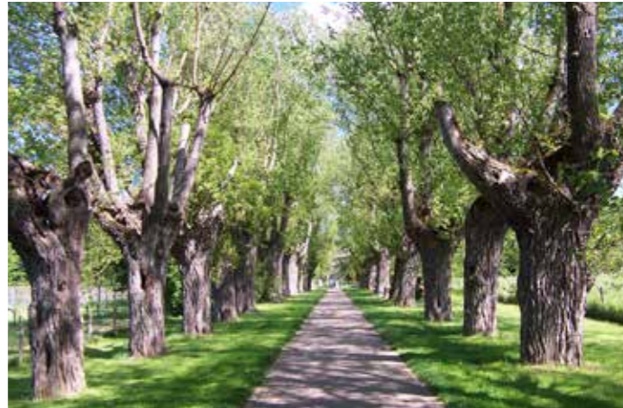
Historische Pappelallee „Jägerallee“ A