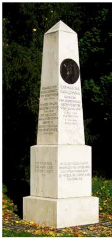
Königin Catharina-Denkmal D