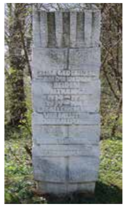
Ehrenmal der Ackerbauschüler C